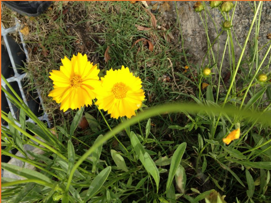
特定外来生物オオキンケイギクの開花