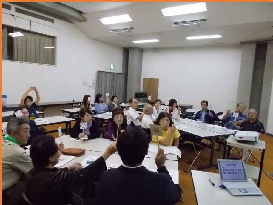
エコの環たまな総会における出張説明会の様子