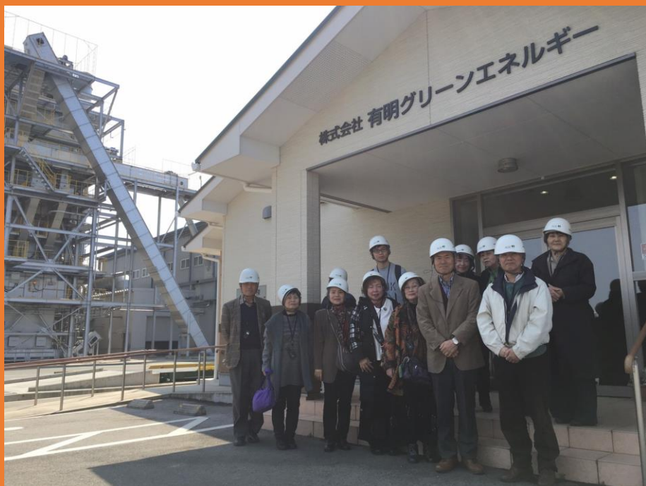
クリーンエネルギーを学ぶバスツアーの参加者