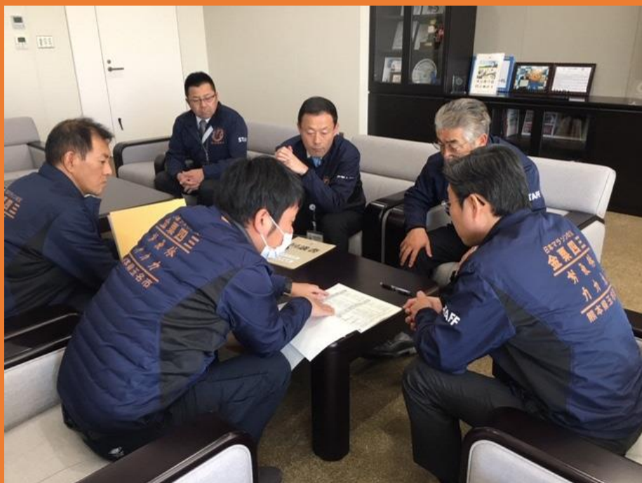
評価結果を市長へ報告している様子

平成30年3月に策定した玉名市地球温暖化対策実行計画（事務事業編）に基づき、市役所、市関連施設のCO 2 排出量を調査し、2018（平成30）年度から2030（平成42）年度までに基準年度2013（平成25）年度比で40.0%の削減を図る。