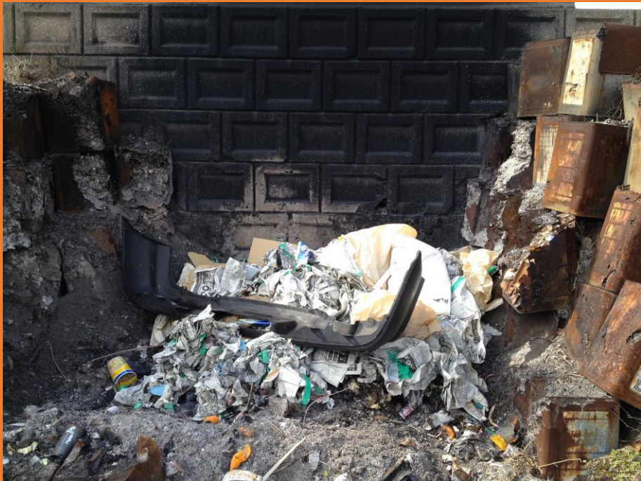
事業所ごみの違法焼却の現場