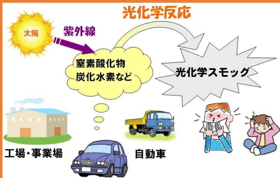
光化学スモッグが発生するメカニズム

光化学スモッグの注意報、警報等を各課を通じて市民に情報提供する。また、情報伝達訓練を実施する。