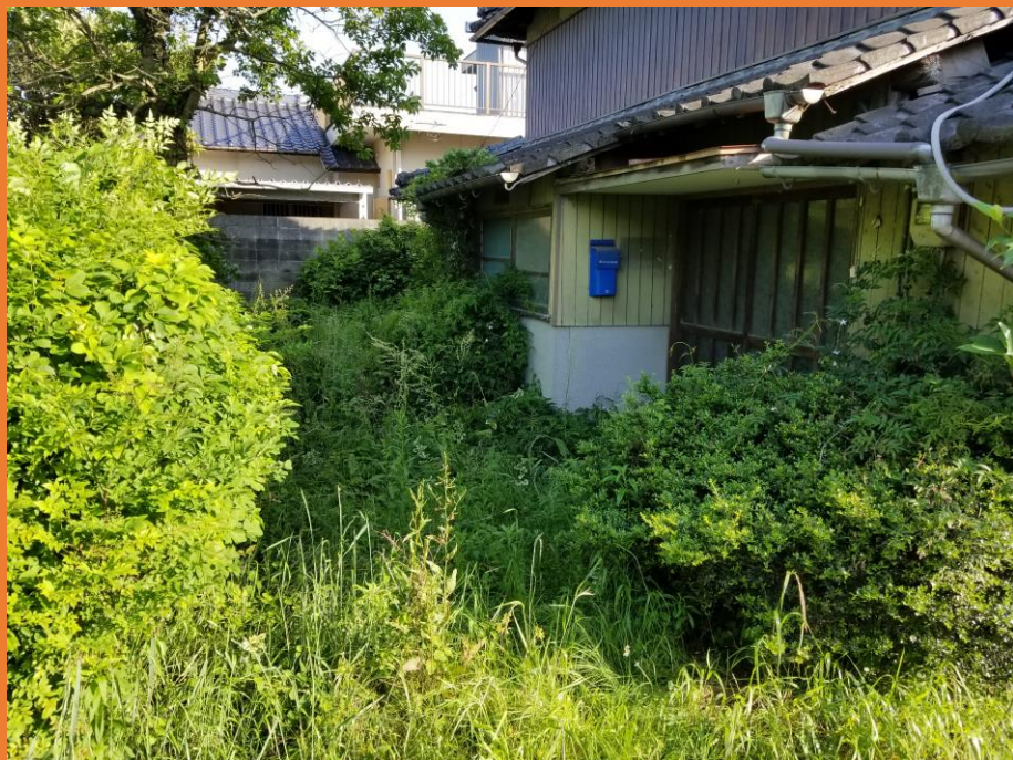
長年放置された宅地に繁茂する雑草や樹木