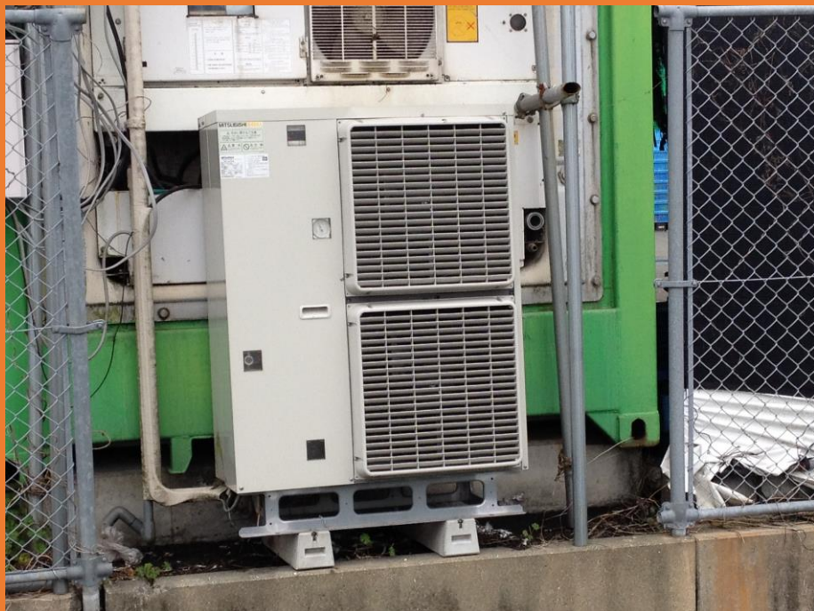
規制対象の一つである冷凍機用圧縮機