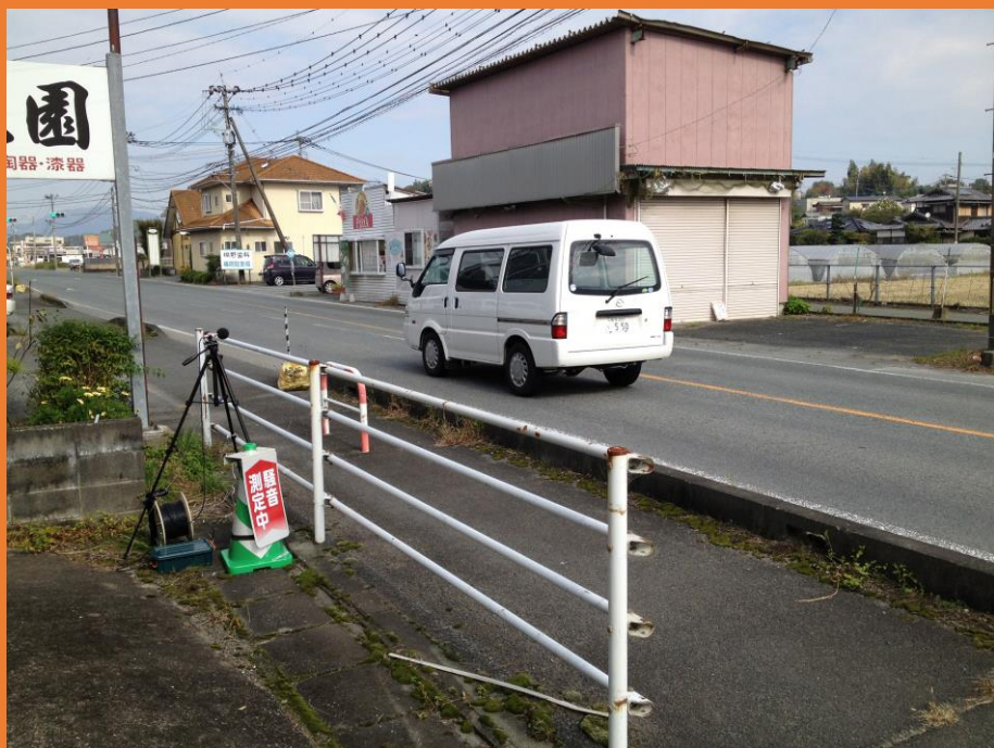
県道1号線における自動車騒音の測定状況