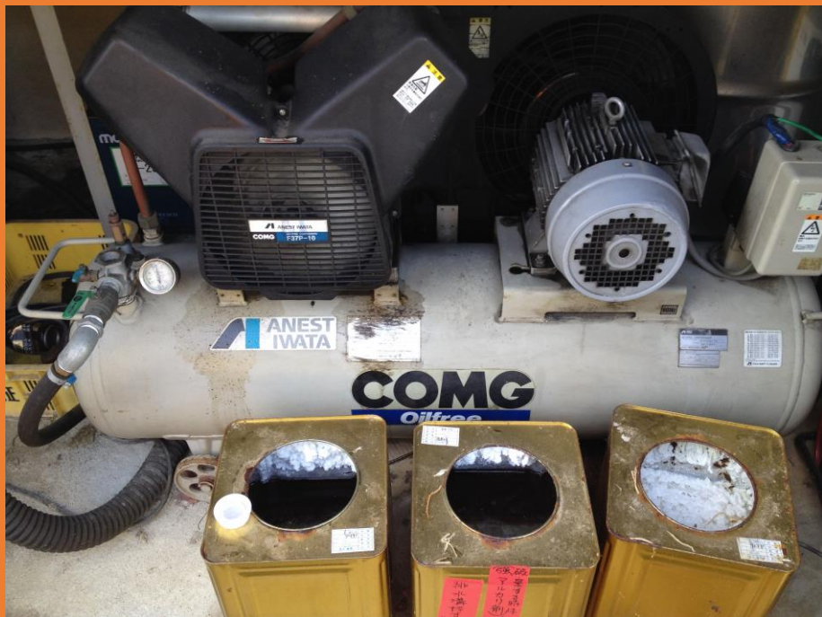
規制対象の一つである空気圧縮機（コンプレッサー）