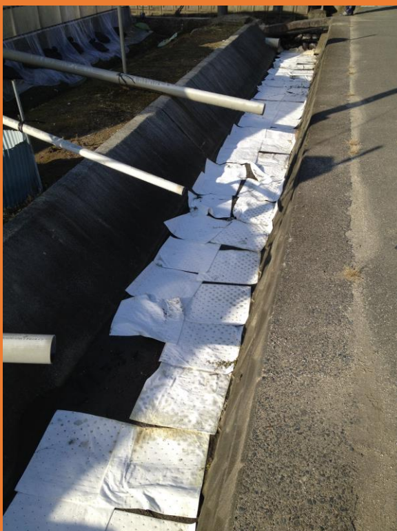
ハウスから流出したA重油を吸着マットで回収する様子