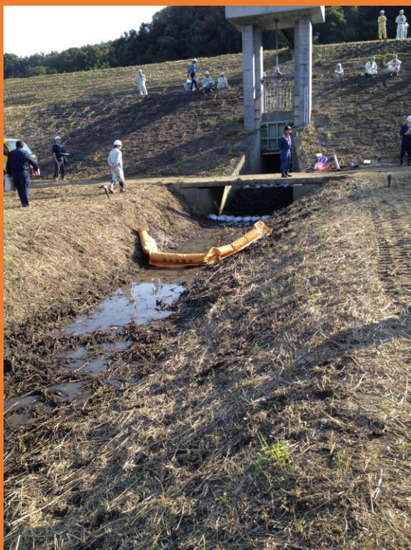
木葉川河川敷における流出油対策訓練の状況

水質汚濁防止業務で、国、県、 他市町との連携を図るため、 会議、合同の水質事故訓練に 参画する。