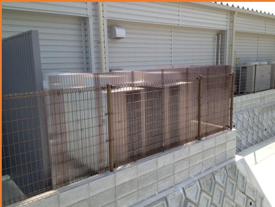
冷凍機用圧縮機の騒音に対する防音壁の設置