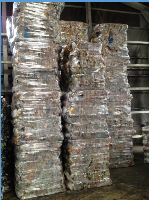
玉名リサイクルプラザで梱包された廃プラスチック

家庭から出されるごみの中 のプラスチック類を再利用 のため、新たに中間処理を委 託する。