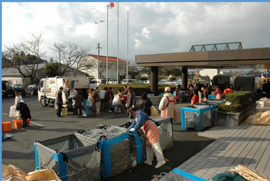
コンテナ回収で使用されているエコバッグ