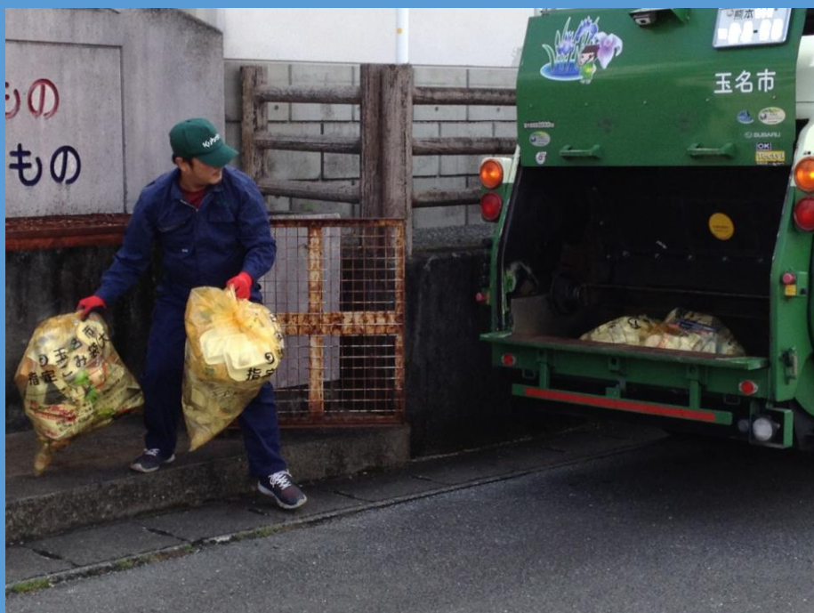
ごみ集積場所における収集状況

家庭から排出される廃棄物の収集運搬について廃棄物処理業者に対し委託を行う。 (平成 24 年度から横島・天水地区も民間委託)