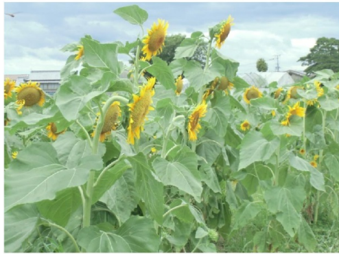
なんとか花を咲かせました