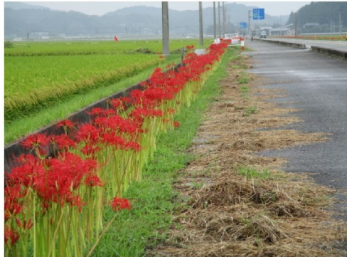
用水路脇の彼岸花