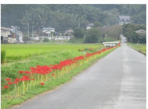
排水路畔の彼岸花