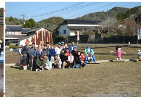
(案山子と記念撮影)