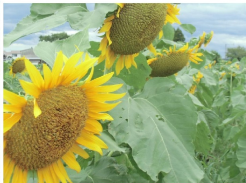
子供達もバンザイです。