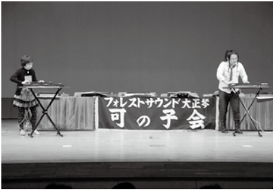
▲お昼のゆっくりした時間に大正琴の音色をお楽しみください。