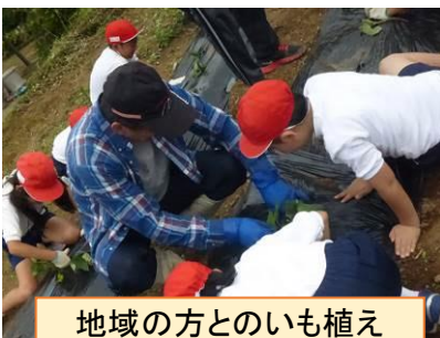
地域の方とのいも植え