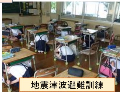
地震津波避難訓練

交通安全協会や天水駐在所の方に来ていただき、交通教室を行いました。安全な登下校を心がけ、交通事故ゼロを目指します。