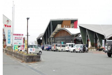
ふるさとセンターY・BOX