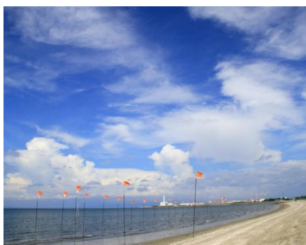
県北唯一の海水浴場『鍋松原海水浴場』