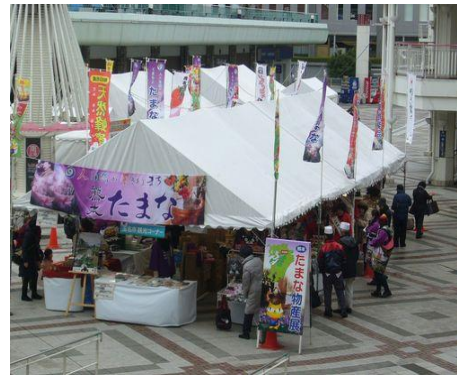
地産フェアの様子