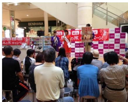
県北観光協議会の福岡キャンペーン

79 特色ある観光地づくり 事業費…18,119千円 (県1,437千円 一般財源16,682千円)