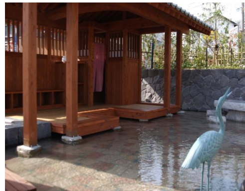
立願寺公園(しらさぎの足湯)

81 草枕交流館 事業費…9,073千円 (自動販売機手数料等132千円 一般財源8,941千円)