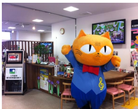
観光ほっとプラザ「たまらら」の内部