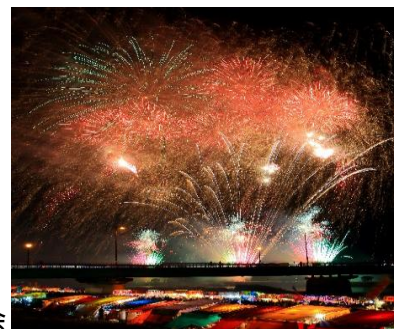
玉名納涼花火大会