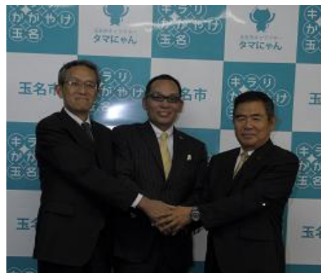
平成26年3月、ベストアメニティ株式会社(食品製造業。本社：福岡県久留米市)と工場立地協定を締結