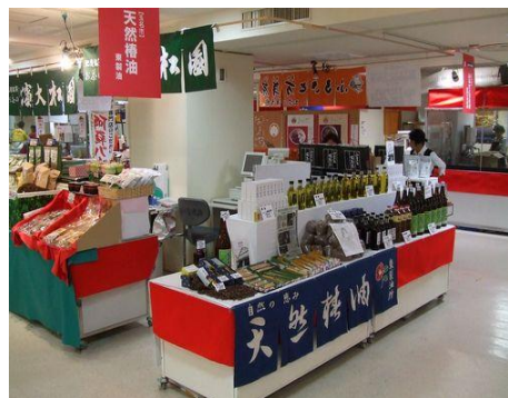
阪神百貨店物産展の様子

77 企業誘致の推進 事業費…100,968千円 (一般財源100,968千円)