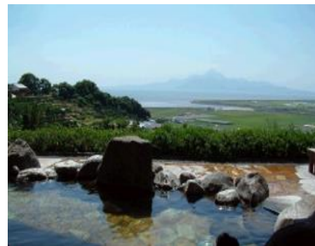
草枕温泉てんすいの露天風呂