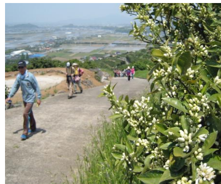
草枕ウォーキング