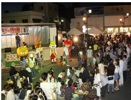
商店街イベント事業