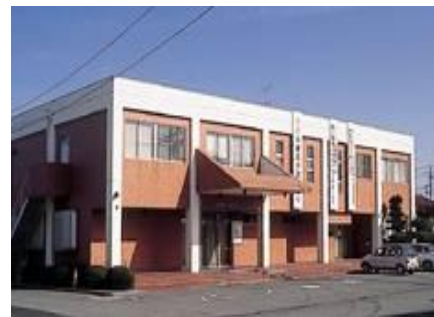
公立玉名中央病院附属健診センター