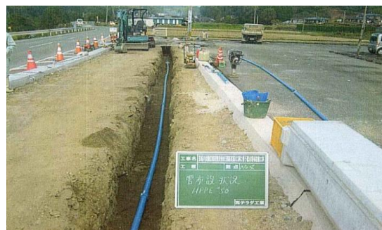
雲雀丘地区配水管布設替工事