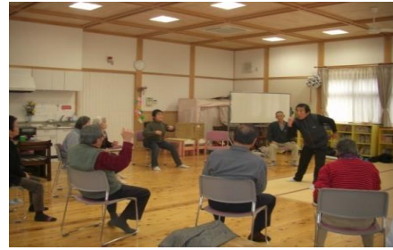
高齢者の健康づくり・生きがいがづくり

交流館には、業務を受託する市社会福祉協議会の指導員が日曜日、水曜日、祝日を除く日の午前10時から午後5時まで常駐しています。