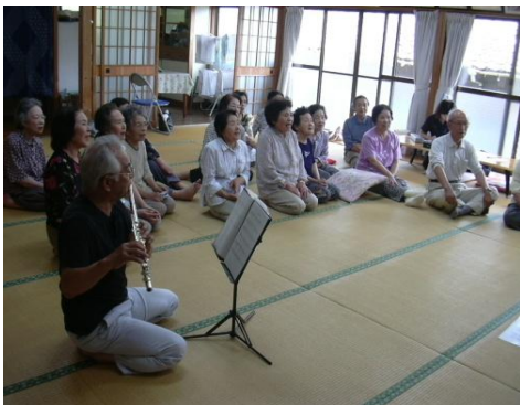
いきいきふれあい活動の様子

地域支援事業:介護予防事業、包括支援事業及びその他の地域支援事業を行うことにより、要介護状態又は要支援状態となることを予防するとともに、要介護状態等となった場合においても、可能な限り地域において自立した日常生活を営むことができるよう支援します。また、高齢者が生き生きとした地域づくりを推進するため、介護予防ボランティア事業を行っています。