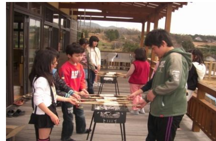
児童の健全育成の場等としてのふれ愛一本松交流館