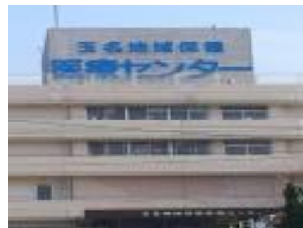
玉名地域保健医療センター