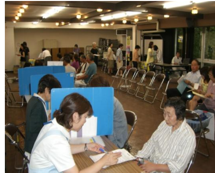
集団健診(特定健診・がん検診)の様子

担当課 … 保健予防課、保険年金課 予算書 … P95 ～ P96 P209 ～ P210