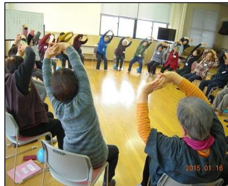
特とく教室の様子(地域支援事業)