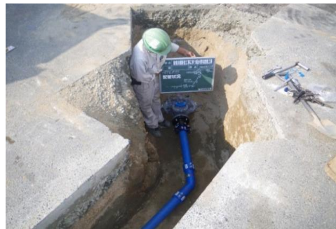
天水町東地区配水管布設替工事