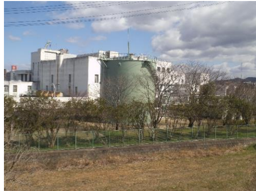
玉名市浄化センター