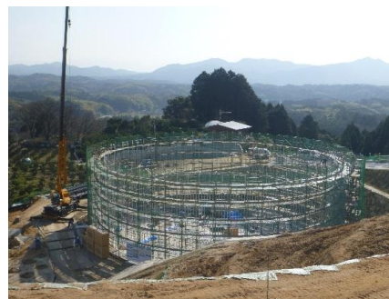
石貫4区3号配水池(施工中)