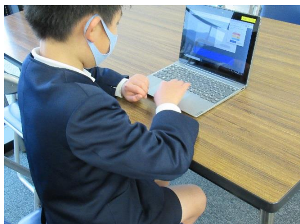
※タブレット使用イメージ