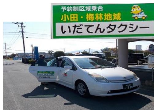
昨年10月から運行を開始した「いだてんタクシー」

JRから受託した肥後伊倉駅と大野下駅の駅管理業務を、近隣住民による団体に委託し、利用者の利便性の向上と環境美化を図ります。