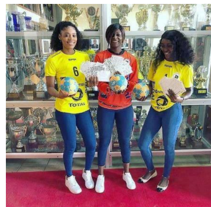
小中学生による手作り応援メッセージを駐日アンゴラ大使の御厚意によりアンゴラ選手に送っていただきました

本市は5月6日に和水町から玉名市へと託された聖火をランナーの手でリレーを行い、市役所を出発し、玉名温泉街までの930mを走ります。