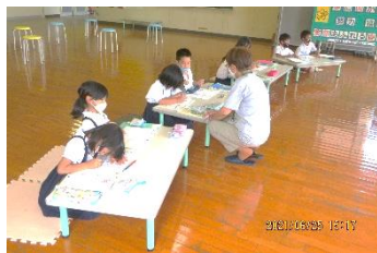
まずは宿題を済ませます。