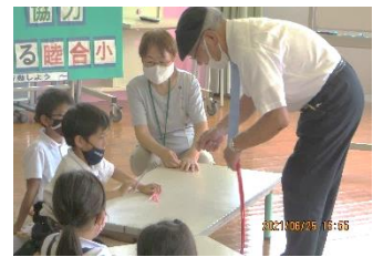
間違いなくロープを切ったぞ！