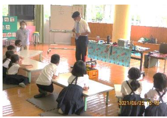
いよいよマジックの始まりだ！