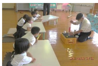
不思議だ？どうしてだ？