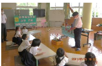
アレ！切ったはずのロープがつながっている！