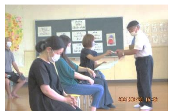
お家の方々も参加されました。